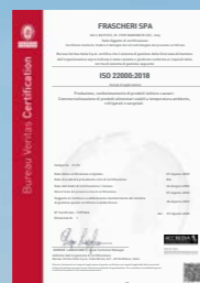
CERTIFICAZIONE ISO 22000