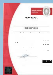
CERTIFICAZIONE ISO 9001

Grazie a uno dei laboratori più all'avanguardia del settore e un sito produttivo in costante rinnovamento tecnologico, Frascheri propone ai professionisti solo prodotti garantiti in termini di qualità e parametri tecnici.